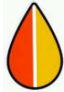
Selo Motorista Idoso