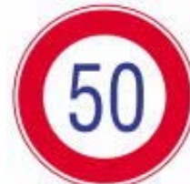
Velocidade Máxima Permitida