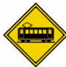
Cruzamento com Linha Férrea