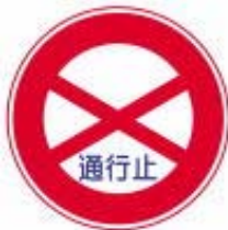
Estrada Fechada ou Proibido Entrar