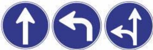
Siga Somente nas Direções Designadas