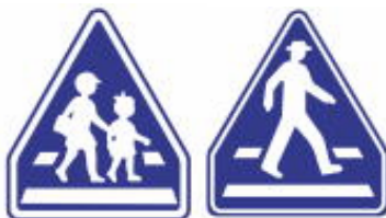
Faixas de Pedestres