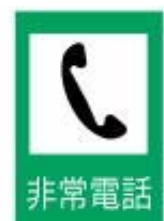
Telefone de Emergência