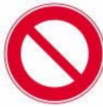
Fechado para Todos os Veículos