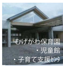
むげがわ保育園 ・児童館 ・子育て支援センター