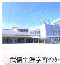
武芸生涯学習センター