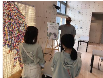
C. ヒトと出会うチーム