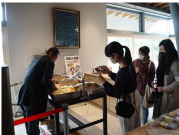
A. 刃物と出会うチーム