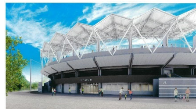
市民球場（令和4年4月 リニューアルオープン）