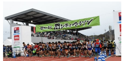
刃物のまち関シティマラソン