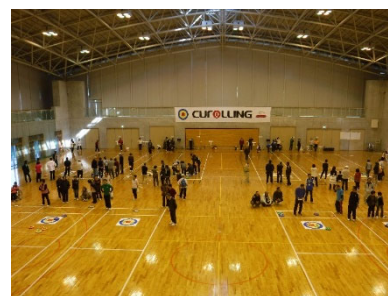
カローリングジャパンカップ (武儀生涯学習センター)