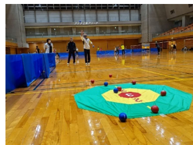
関市スポーツ推進委員研修会 〈障がい者スポーツ(ボッチャ)〉

※スポーツ推進委員は、地域住民にスポーツに関する指導及び助言を行う人たちで、スポーツ基本法に位置づけられています。