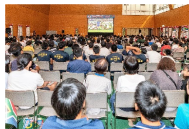
ラグビーワールドカップ2019 「日本 vs 南アフリカ」 パブリックビューイング (総合体育館)