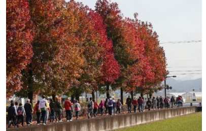
はもみん・はつらつウオーキング