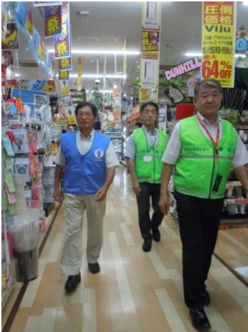
夏休みの中央補導

このため、関市少年センターでは、専任補導員による日常の巡回補導をはじめ、少年補導員連絡協議会委員や市内小中高等学校生徒指導の先生方との合同による特別補導などを実施しています。また、各支部のボランティア補導員の皆さんによる地域補導活動も計画的に実施していただいております。